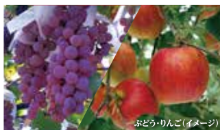
ぶどう・りんご(イメージ)

※ このツアーは実証運行となります。ご参加のお客様にはアンケートにご協力いただきます。