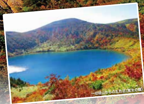
一切経山からの五色沼(魔女の瞳)

土湯峠と高湯温泉を結ぶ全長28.7kmの山岳観光道路。吾妻連峰を縫うように走るパノラマコースは、山並みや溪谷、奇岩などのビューポイントが点在。季節ごとに魅力的な表情を堪能ください。