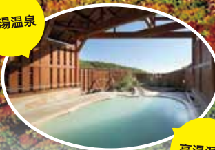
高湯温泉共同浴場「あったか湯」